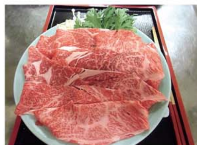
料理イメージ(2人前)

お店でお食事をされない場合は、2名様分よりお肉(2名様和牛肩ロース600g)と割り下をセットで自宅に配送できます。 *追加料金は発生いたしません。 【申込方法】お食事券と一緒に申渡す専用申込用紙をFAX 【配送方法】クール便 お申込みから5日ほどお時間がかかります。