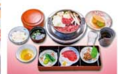
昼の中江コースイメージ