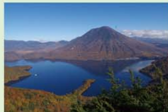
中禅寺湖と男体山

台東区と日光市は、昭和60年5月10日に友好都市提携を結び、今年度で40年の節目を迎えました。 東武鉄道直結という関係を背景として培ってきた住民同士の絆を深めてきました。これからも、伝統文化や自然の中での人と人の触れ合いを通じて、今日まで育んできた友情を一層深いものとするともに、豊かな地域社会の創造と両都市相互の行政、産業等の進展のため最善の努力をしていきます。