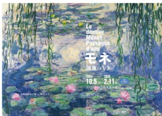
クロード・モネ《睡蓮》(部分) 1916-1919年頃 油彩/カンヴァス マルモタン・モネ美術館、パリ