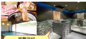
岩盤浴付 (館内着・タオルセット) 写真はイメージです