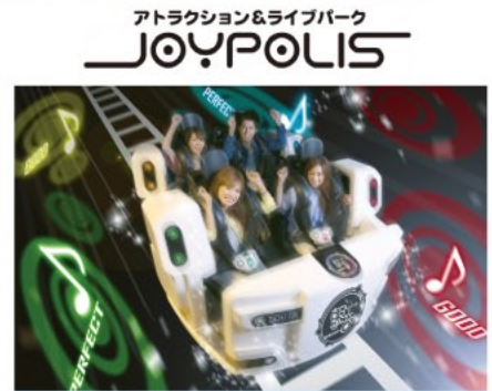
東京ジョイポリス 所在地: 港区台場1-6-1 DECKS Tokyo Beach 3~5F 施設詳細・営業時間等については、公式ホームページをご確認ください。