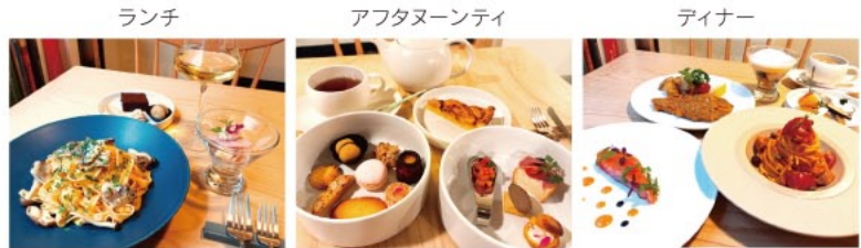
※写真は一例となります。

本場イタリアで経験を積んだシェフによるイタリアンレストランが今年3月にオープン。自家製生パスタのランチや、イタリア郷土菓子を織り交ぜたアフタヌーンティー、本格的なおまかせディナーコースをご堪能いただけます。