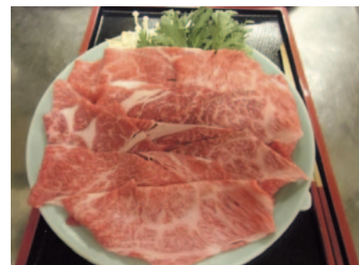
料理イメージ(2人前)