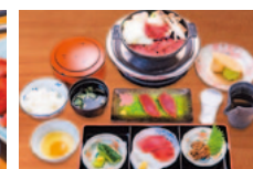
昼の中江コースイメージ