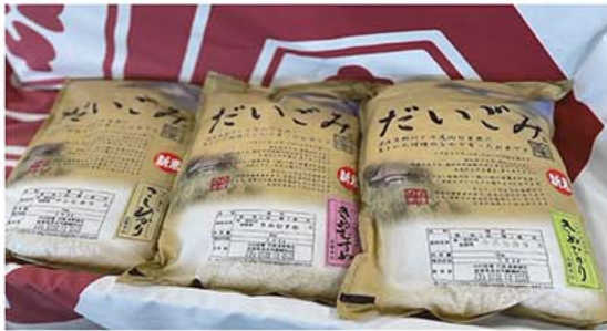
こしひかり5kg×1袋、きぬむすめ5kg×1袋、きぬひかり5kg×1袋