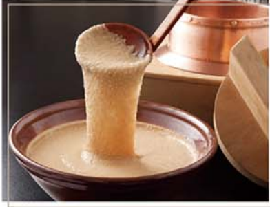
味付きとろろ 12食セット