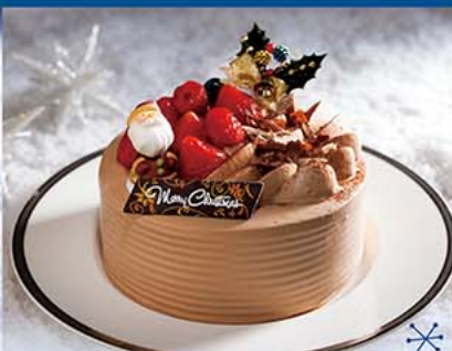
2. ショコラ・ショート