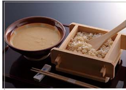
味付とろろ・むぎごはん 2パックセット

内容 味付とろろ(80g×4袋)×2パック むぎごはん(90g×4袋)×2パック