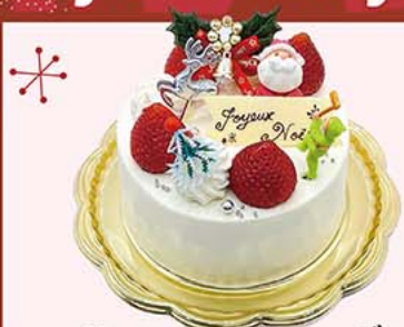
1. ノエル・フレーズ

しっとり焼き上げた香りの良いスポンジ、オリジナルブレンドの生クリームとフレッシュな苺。素材の持ち味が堪能できる一品。