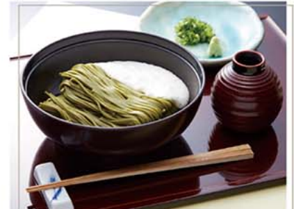
とろろ茶そば 6食セット