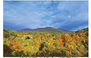
宮城県大崎市 鳴子峡

申込先 大崎市観光物産センター 土蔵 FAX 0229-25-8635 または 台東区勤労者サービスセンター会員専用 楽天ストアサイト