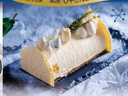
3. タタン・ブランシエ

キャラメルをたっぷり使い、煮上げたリンゴとマスカルポーネのムース。ホワイトチョコで仕上げた聖夜を彩るホワイトクリスマスケーキです。