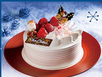
1. ストロベリー・ショート