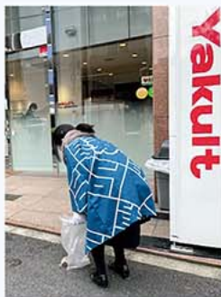
東京ヤクルト販売株式会社 様