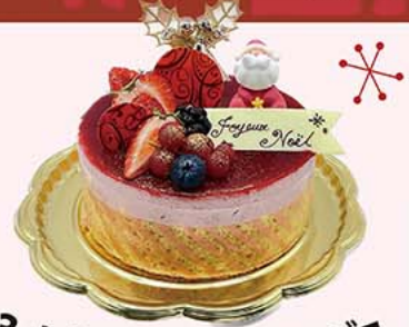
3. レトロ・ノエル・ルージュ

フランボワーズとレッドフルーツのムース、中央にカシスのコンフィチュールとスポンジ、トップにフランボワーズのジュレ、側面をピンクの縞柄のスポンジで巻いて、レトロな雰囲気仕上げました。