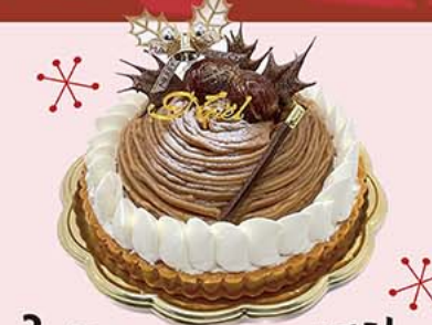
2. タルト・オ・モンブラン

香ばしく焼き上げたタルトの上にスポンジとドーム型のマロンムース。マロンクリームを絞り仕上げました。