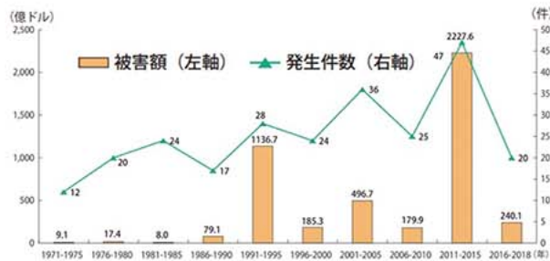
我が国の自然災害発生件数及び被害額の推移

死者、行方不明者約10万5千人という未曾有の被害をもたらした関東大震災から今年で100年になります。震災から100年、世界は社会経済が発展して生活が豊かになりましたが、反面、経済活動に伴い温室効果ガスが急増し、地球規模の気候変動をもたらしました。近年各地では、台風や大雨の規模、頻度が増大し、自然災害が激甚化しています。右図は1971年以降の自然災害発生件数と被害額の推移を示したものです。大地震の発生した年は大きな変動がありますが、1886年以降、件数、被害額ともに増加する傾向があることがわかります。