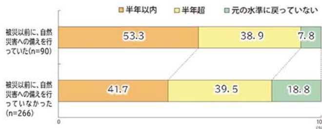
被災前における自然災害への備えの有無別に見た、下がった売上が元の水準に戻るまでに掛かった期間

首都直下地震、河川の氾濫など、大災害発生は他人ごとではない状況です。皆様は、災害に備えて準備をしていますか。災害に備えることは、人命・財産を守ることはもちろん、事業継続の観点からも重要です。右図は、被災経験がある事業者について、被災により下がった売上が元の水準に戻るまでの期間を、事前対策の実施有無別にアンケート調査した結果です。事前対策を行った事業者は半年以内に復旧している割合が高く、また元の水準に戻らなかった割合が低くなっており、事前対策が有効であることは明らかです。