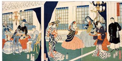
横浜異人商館座敷之図 五雲亭貞秀 大判錦絵三枚続 文久元年(1861) サントリー美術館 【展示期間:10/11～10/30】

受付・引渡期間 9月20日(水)～11月20日(月) サービスセンターの窓口又は電話にて受付を行います。会員証持参のうえ、サービスセンター窓口で代金と引換えにお受取りください(郵送受取も可)。購入後の払戻しはできません。