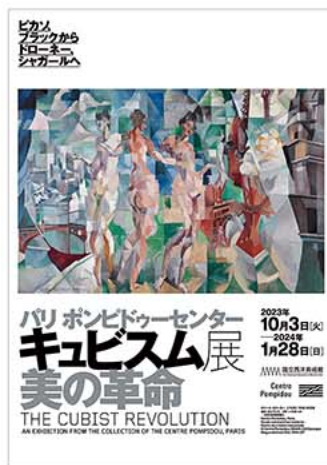
展覧会ビジュアル

受付・引渡期間 9月20日(水)～11月20日(月) サービスセンターの窓口又は電話にて受付を行います。会員証持参のうえ、サービスセンター窓口で代金と引換えにお受取りください(郵送受取も可)。購入後の払戻しはできません。