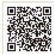
防災用品セット 申込みフォーム