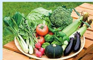
道の駅でお買い物