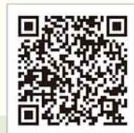
BCP(事業継続計画)の策定支援 <職場環境等向上支援>

詳細は台東区産業振興事業団のwebサイトをご参照ください。 https://taito-sangyo.jp/2023/03/13/bcp/