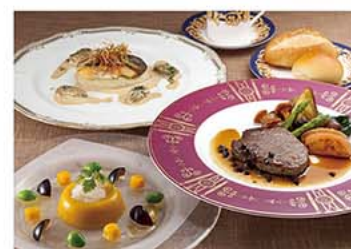
「シャルマン」イメージ