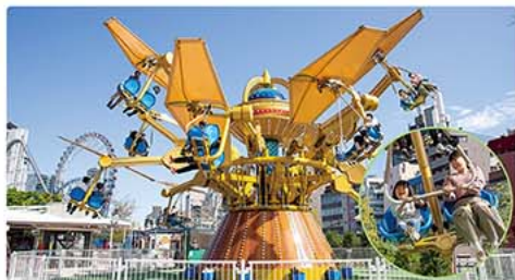
コズミックトラベラー