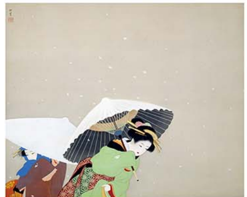
上村松園 《牡丹雪》 1944(昭和19)年 絹本・彩色 山種美術館

サービスセンターの窓口又は電話にて受付を行います。 引渡し時、会員証をご呈示ください。購入後の払戻しはできません。