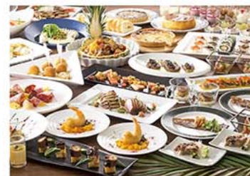
エトワール料理イメージ

※ 土日祝のご利用の方は、700円の割増料金を利用当日店舗でお支払いください。 ※ 小学生以下のお子様のご利用は、店舗にお問い合わせください。