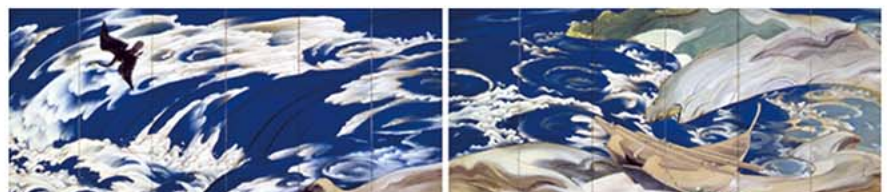
川端龍子 《鳴門》 1929(昭和4)年 絹本・彩色 山種美術館