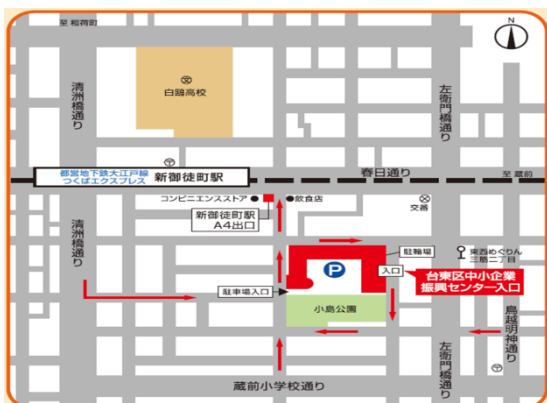
◎新御徒町(大江戸線、つくばエクスプレス)A4出口徒歩 3分

台東区中小企業振興センター会議室 (東京都台東区小島2-9-18) TEL 03-5829-4125